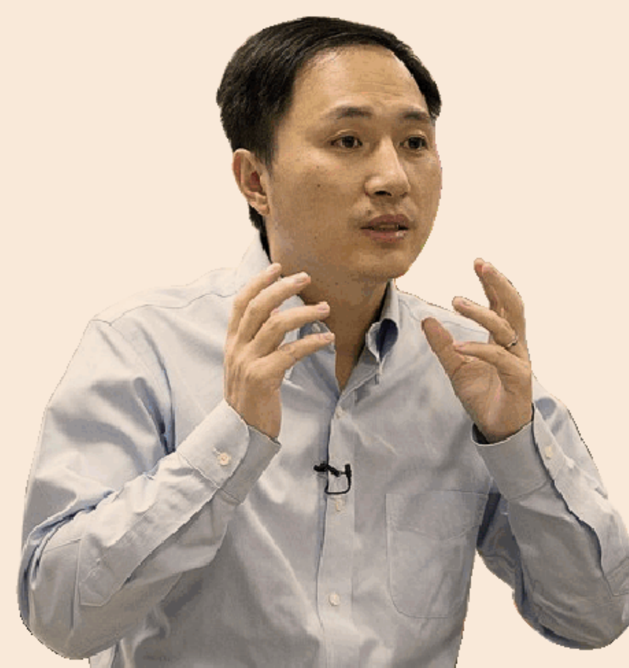
He Jiankui. Per il tribunale cinese ha violato le normative nazionali in materia di ricerca scientifica e cure mediche

Editing genetico Tre anni di carcere per He Jiankui, il genetista cinese che fatto nascere le prime due bambine con il Dna modificato